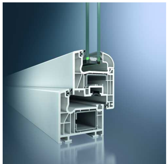
Combinación de perfiles estándar; E 1:2